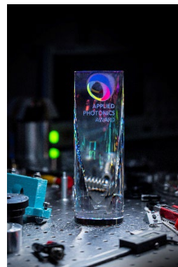
Abb. 3: Die Preisverleihung findet im Rahmen des Photonic Days Jena statt.